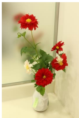
花瓶に活けられた「ダリア」の花

本学1号館事務室に近い来客用・教職員用トイレの洗面台の傍らには毎日のように花瓶にお花が活けてあります。本学を清掃して下さる株式会社 三勢さんが掃除の際に活けていかれるものです。手を洗う時、ふと目に留まる花。心温まる瞬間です。いつもありがとうございます。ごさいます。